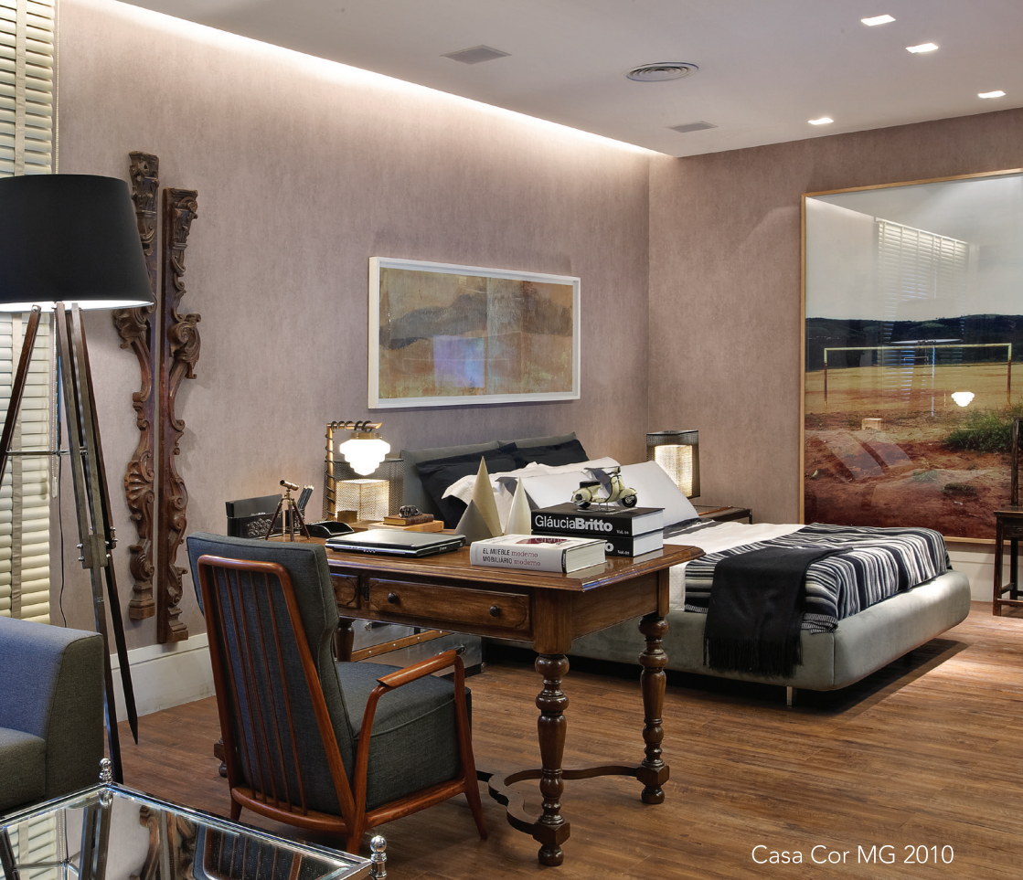
Casa Cor MG 2010