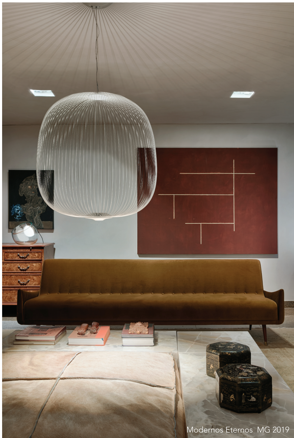
Modernos Eternos MG 2019