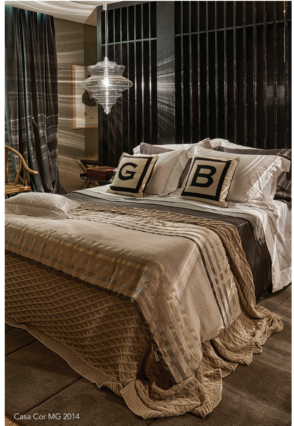
Casa Cor MG 2014