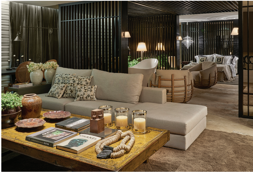
Um Refúgio na Montanha com móveis garimpados em antiquários, trazendo elegância ao ambiente criado para dar muito aconchego, relaxamento e celebrar momentos felizes.